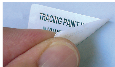
... dann einwirken lassen und ganz einfach abziehen!